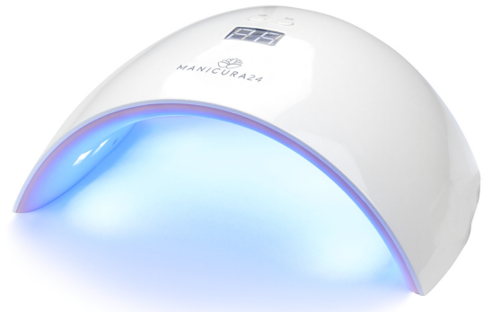
Lámpara UV/LED 24W

LOS PRODUCTOS SE PUEDEN COMPRAR EN KIT* O POR SEPARADO.