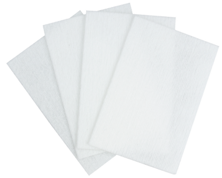
Nail Pads Toallitas para uñas 200 uds