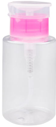
Dispensador Para líquidos