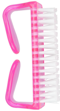
Cepillo de manicura